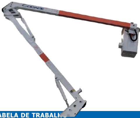
TABELA DE TRABALHO